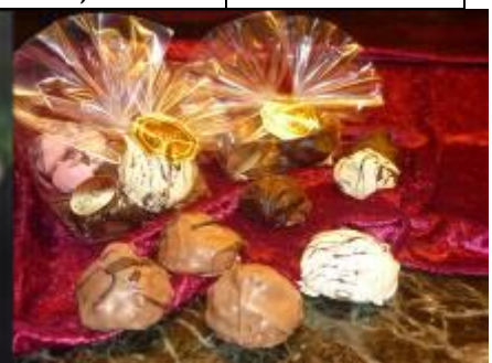
5 Mini-Elisen bunt gemischt nach Tagesangebot, Art.1345