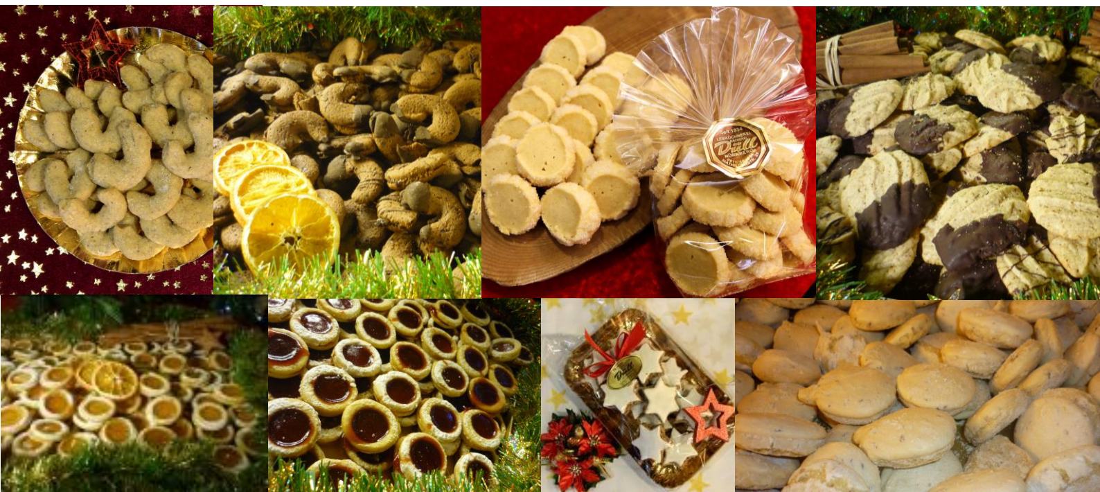
Marillenringe Art. 1420