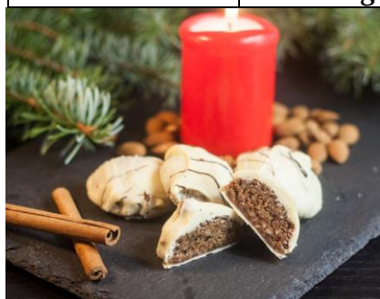
Elislein weiße Schokolade Art. 1436