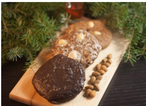
Art. 1285 3er-Klassisch