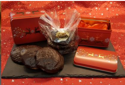
„Schneestern truhe“ Art. 1538