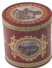
„Rot mit Goldstern“ Art. 1522