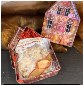
„Hexenhaus“ Art. 1532