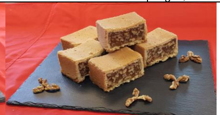
Nussecke klassisch Art. 629