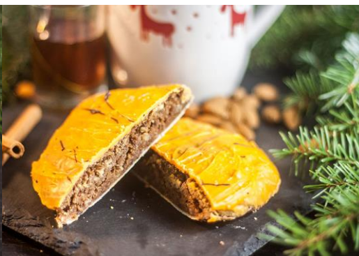
Art. 1263 Orangelebkuchen