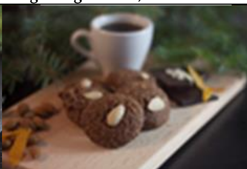
Elislein naturbelassen Art. 1338