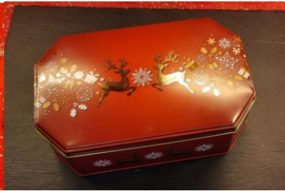
„Elchtruhe Achteck“ Art. 1919

Unsere traditionelle Silberrittertruhe ist inzwischen so beliebt, dass wir sie in vier verschiedenen Füllungen anbieten: