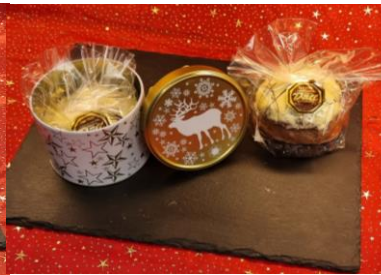
„Dose Elch Gold“ Art. 1923