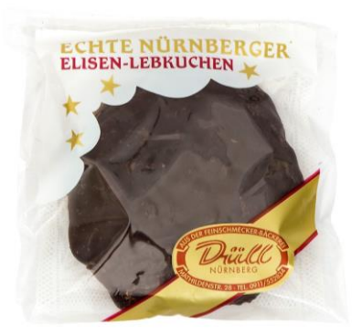
Art 1298 Zartbitterlebkuchen